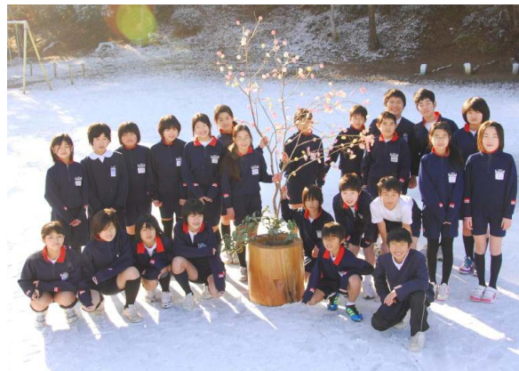
まゆ玉飾りを囲んで

さて、学年のまとめの時期として、学校では1月から「基礎的基本的な知識・技能の習得」と「思考力・判断力・表現力の育成」とのバランスを大切にしながら学力向上に向けて取り組んでいます。その学年で身につけるべき内容を確実に習得させることを目標に、個に応じたきめ細かな指導を大事にしています。さらに、基礎学力を基に「自分の考えを持つ」、「思いや考えをことばで相手に伝えようとする」等、ことばによる表現力の育成を目指しています。ことばの力をつけることで問題を読み解く力や考えをまとめる力、そして伝えようとする力を身につけることができます。そのためには、読書習慣、多様な体験、望ましい生活習慣、そして、よい親子関係等が必要です。子どもたちの幅広い学力の向上へ向けて家庭と学校が連携していきましょう。