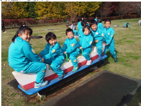
班のみんなで仲良くシーソー！キャーという叫び声とワハハという笑い声が混ざっていました。

12月はまとめの学習に重点を置いていきます。寒さも厳しくなってきます。好き嫌いせず何でも食べ、睡眠を十分にとって、心も体も元気な毎を送りたいものです。ご家庭での体調管理も引き続きよろしく願います。