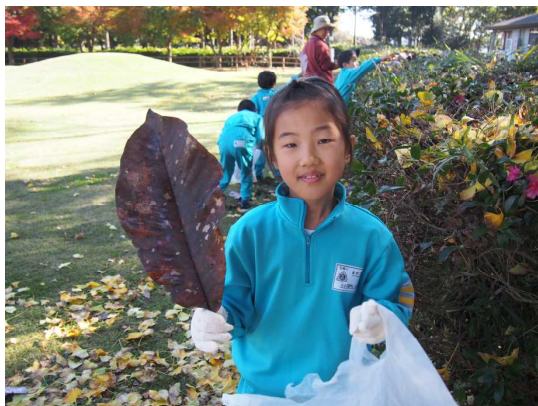
ほうの木の葉っぱをたくさん拾いました！押し葉にした子どもたちでした・・・。