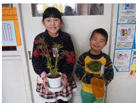
保健係のメンバー