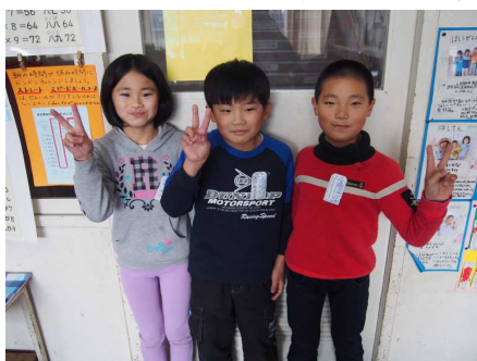
配り係のメンバー

新しい係も自分たちで話し合いながら決め、2学期に担当をしていた友達から、やり方を教わりながらクラスのために活動しています。