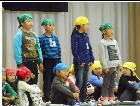
(閉校記念式典での様子)

1年間を振り返ると、さまざまな学習や行事を通して、子ども達はたくましく成長してきました。「もうすぐ、3年生」という言葉も、もう目の前に迫ってきており、3年生への準備の時期です。全員が胸を張り、自信を持って3年生に進級できるよう、学習と生活のまとめにしっかり取り組んでいきます。