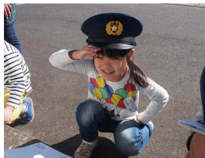
(おまわりさんにインタビュー)

11/28(土)の3校合同マラソン大会に向けての練習が本格的に始まります。月、水、金の中休みに全校児童で5分間走ります(本番、低学年が走る距離は800mです)。自分のペースで良いので、歩くことなく最後まで走りきることができるように、また、目標に向かって頑張れるよう励ましていきたいと思ます。