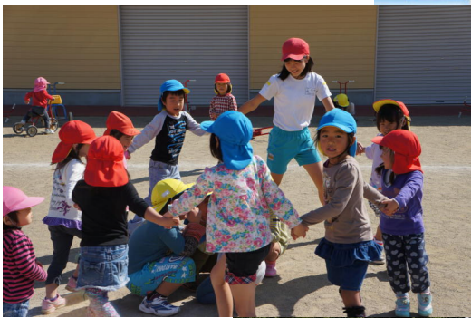
上：みんなで遊ぶ ためには