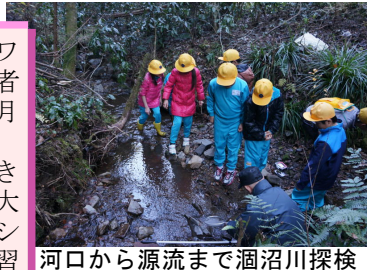
河口から源流まで涸沼川探検