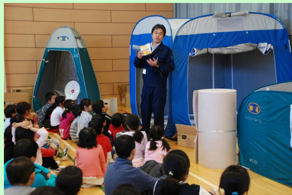
非常時簡易トイレや避難所簡易間仕切り等見学

本事業は、町消防本部・町総務課防災グループの皆さんにご協力を頂きました。区長さんをはじめ、地域の方にご参加いただきました。児童と地域の皆さんと一緒に防災訓練を実施することで、学校と地域のつながりの強化と、広浦小学校が地域の避難拠点として機能できるようになればと考えています。