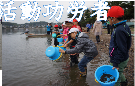
シジミの稚貝放流

平成27年度クリーンアップひぬまネットワーク事務局より、本校が水質浄化活動功労者に決定したとの通知をいただきました。11月28日には表彰式が行われます。