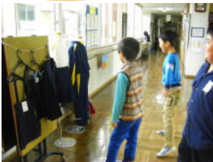
展示した標準服、体操服を見る児童

☆11/20（金）9:30から本校体育館にて、スクールバス説明会が開催されます。（すでに配布の「11月12日発行 統合準備委員会ニュース第4号」も、あわせてご一読ください。）