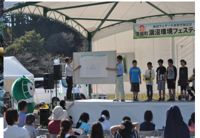
各種イベントでの発表