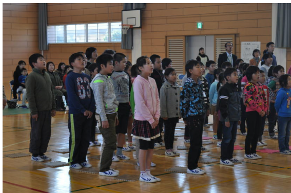
ピアノ・バイオリン・フルート・トランペットの音色と合わせての校歌斉唱

目の前で演奏は、音のひびきが身体に直接伝わり、さらに、そのひびきは子供達の心まで届いているようでした。演奏後、4人の音楽家の方々から「温かい雰囲気の子供達、学校ですね」という、うれしい言葉をいただきました。