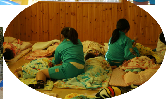
寝かしつけて ホッと一息

6年生は、今年これまでに、介護老人保健施設レイクヒルひぬままでの福祉体験をはじめ、様々な年代や様々な職業の方にふれています。10月27日（火）には、ひぬま保育園で一日保育体験をさせていただきました。保育園の先生の大変さを感じるとともに、保育園の先生の子どもに対する思いも感じたようでした。さらに、自分たちも、幼稚園の先生や保育園の先生、そして、親の愛情をたくさん受けて育ったことにも気付いたようです。一日の体験を終え学校に戻ってきた6年生の表情には、心地よい疲れの中に達成感や満足感がありました。