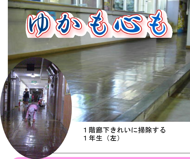
1階廊下きれいに掃除する 1年生（左）