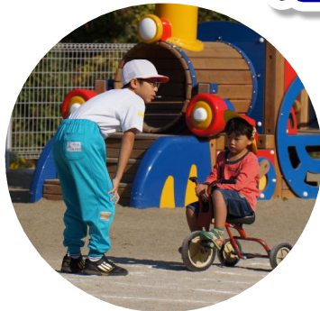
上・右：目線を合わせて