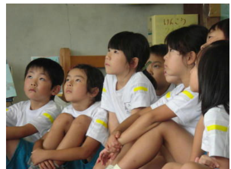
図書館の方の本の読みきかせを聞く1年生

11月は、各家庭においての親子読書や学校での読書郵便を推進しています。これを機に、ご家族で読書の時間を設けてみませんか。