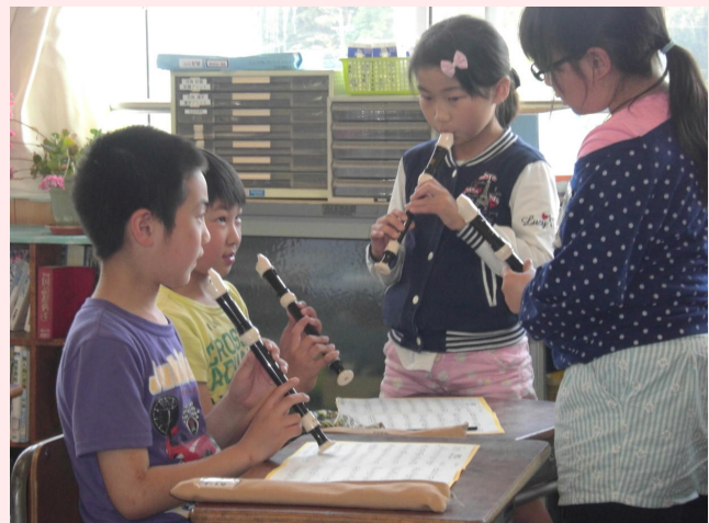
放課後の風景「音楽のつどいに向けての練習」

地域の皆様には、ご迷惑をおかけすることもあるかと思いますが、演奏が少しずつ形になっていく様子を、聴いて頂ければと思います。例年のように「しいの木まつり」でも演奏予定です。