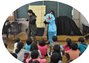
語りと人形劇「この次なあに」

狸が一人ぼっちになってしまった最後の場面を観て、子ども達も様々考えたようでした。