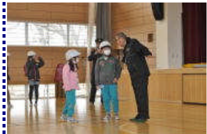
不審な人に声をかけられたときを想定した訓練

校舎内に不審な人が侵入したという場面を想定した訓練と登下校時に不審な人に声を掛けられたときの対応等の訓練を実施しました。