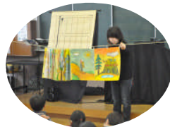
カーテンシアター 「てんぐとカッパとかみなりどん」