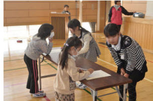
縦割り班対抗給食クイズ

児童のアイデアあふれる集会になりました。「食の大切さ」や「感謝の気持ち」をもったと共に、企画した子ども達は、満足感・達成感もいっぱいになったようで「いきいき」「わくわく」な姿でした。