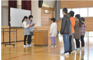
代表児童への完食賞の表彰