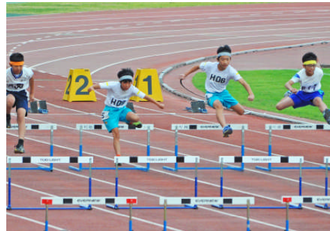
80mハードル(男子)決勝

水戸市のケーズデンキスタジアム水戸で開催された記録会に、本校からは、5、6年児童21名が参加しました。この記録会まで毎日練習を行い、どの子も目標をもって記録会に臨みました。練習開始から当日まで子どもたちのたくさんの「わくわく」(目標や夢の実現に向けて)が見られました。本校の入賞児童と記録は以下の通りです。