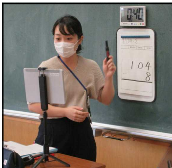
～ 2年生 算数～

3週間のオンライン学習期間から分散登校を経て、10月1日から通常登校になります。オンライン学習ではご家庭のご協力をいただき、オンライン学習が始まった日からほぼ毎日100%の子供たちとつながることができました。日を重ねるほどに子供たちのタブレット操作が上達し、課題を提出したり、歌を自撮りして提出したりする学年もありました。オンライン学習期間中、お子様に付き添ってくださっていたご家族の皆様へ感謝申し上げます。先生たちは、本格的に取り組むタブレットを活用した新しい学びのスタイルに向けて、日々研修を重ねています。オンライン学習期間中の様子についてアンケート調査を行い、改善に努めていきたいと思っておりますので、ご協力の程、よろしくお願いいたします。