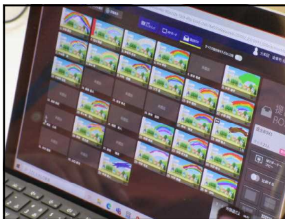
～オクリンクで提出～