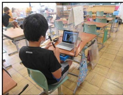
～リコーダー運指練習～