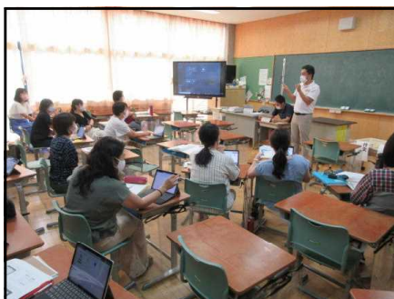
～ Teams の接続を練習する先生 ～

9月1日から9月10日まで臨時休業日です。タブレットの持ち帰りやオンライン学習のスタートでは、保護者の皆様にとくさんのご協力をいただいております。学校では、児童一人一人のタブレットにつないで朝の会や帰りの会ができるように研修をしています。子供たちが分散登校時に練習する内容は、Microsoft Teams（マイクロソフト チームズ）を起動させてオンライン朝の会に参加する方法です。家に帰ってからの接続テストや9月3日の接続テストでは、Teamsの接続をすることになります。接続テストの予定は、別紙の通りです。子供たちに配布する「茨城町立小中学校 オンライン学習のマニュアル」を見ながら、接続を試してください。また、「茨城町立小中学校 学校のICT機器の使い方のきまり」も配布します。情報モラルや情報セキュリティを守って正しい使い方ができるようにご家庭でのお声かけや見守りをお願いいたします。