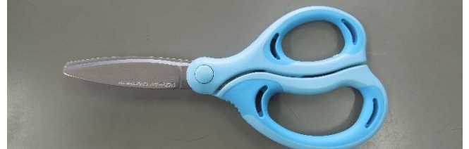
ハサミ ※ 携帯用のものは不可