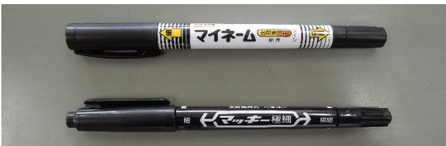
ネームペン・油性ペン