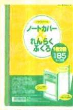
連絡帳カバー SEB5C ¥540-