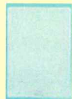
ソフト下敷き MS-36 ¥210-