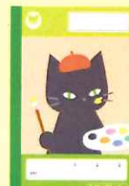
自由帳 T-59 ¥190-