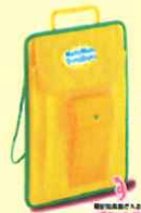
探検バック MC3 ¥930-