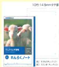
連絡帳 L50-1 ¥210-