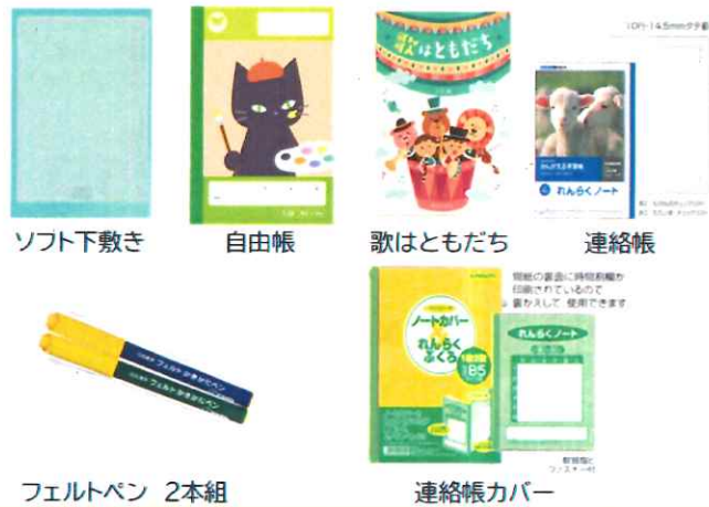
ソフト下敷き 自由帳 歌はともだち 連絡帳

・学年・クラス・出席番号に関しましては、 入力が必要になりますので「1年1組1番」 と入力してください。